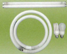
蛍光管・電球型蛍光管