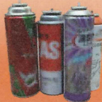
スプレー缶 カセットポンペ